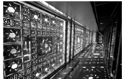
blende in der fassade