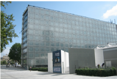
institut der arabischen welt, jean nouvel - 1987

Durch eine Reihe von Leitblechen, die sich automatisch je nach Sonneneinfall bewegen, hat Nouvel eine eindrucksvolle Fassade geschaffen, die sich durch typisch arabische Geometrien auszeichnet und dem Besucher den Zauber der islamischen Ikonographie vermittelt.