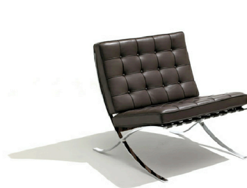
barcelona, mies van der rohe - 1929

La linea essenziale e filante è perfetta e ancora oggi ci fa sognare.