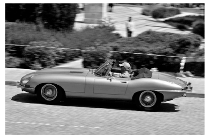
jaguar e-type - 1961