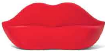
bocca, gufram - 1971

Gli elementi formali attinenti all'immaginario erotico abbinati all'uso del colore rosso concorrono a catalizzare l'attenzione dell'utente.