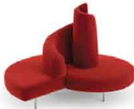
tattlin, edra - 1989