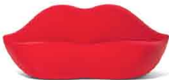
Bocca, Gufraam - 1971

Die formalen Elemente, die sich auf das erotische Imaginarium beziehen, kombiniert mit der Verwendung der Farbe Rot, tragen dazu bei, die Aufmerksamkeit des Benutzers zu wecken.