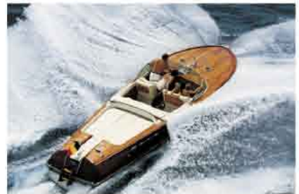
Aquarama, Riva - 1962