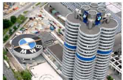
BMW 4-Zylinder, Munich - 1973