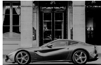
Ferrari F12 Berlinetta